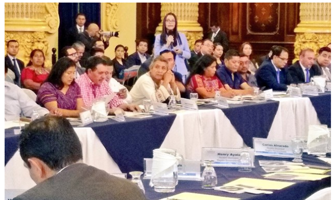
Discusión de los Objetivos de Desarrollo Sostenible en el CONADUR.

El proyecto busca fortalecer las capacidades institucionales de la SEGEPLAN. A través de la asesoría que SEGEPLAN brinda a los ministerios, estos se ven fortalecidos en la planificación, implementación y monitoreo de las prioridades nacionales de desarrollo. Adicionalmente, se crean redes para la coordinación inter institucional. Con ello, el proyecto aporta a la vez al ODS 17 al fomentar capacidades nacionales de implementación, apoyar a las instituciones en una planificación del desarrollo a largo plazo, aumentar la concordancia entre planificación y ejecución, apoyar el intercambio de conocimientos, mejorar la coordinación inter institucional, ampliar el monitoreo a través de la digitalización y formatos virtuales y aumentar la rendición de cuentas.